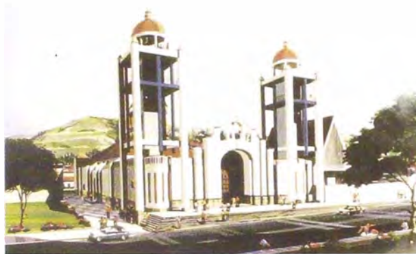
Foto 6. Nueva Catedral de Huaras. Perspectiva.