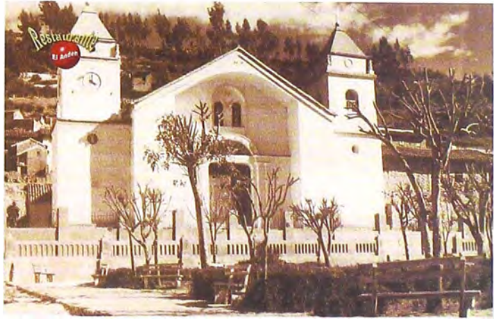
Foto 4. Iglesia de San Santiago de Aija. Antecedentes.

concluyendo en 1965 (ver Foto 1). Pero la tranquilidad de los huaracinos va a ser turbada por un acontecimiento externo, el terremoto de 1970, que daña severamente la catedral, por ello Comisión de Reconstrucción y Rehabilitación de la zona afectada por el sismo del 31 de mayo de 1970 (CRYRZA) ordena su demolición. Francisco Gonzales (1992), ex Director del INC - filial Ancash, describió la iglesia de la siguiente manera: