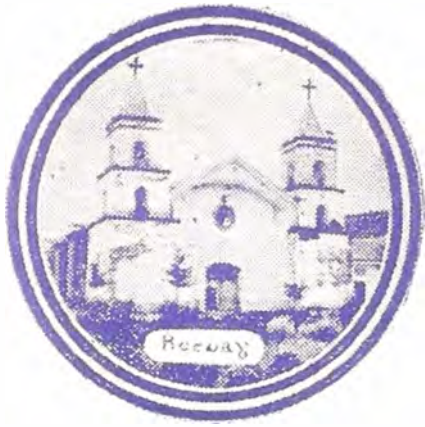
Foto 2. Iglesia de San Ildefonso de Recuay. Antecedentes.