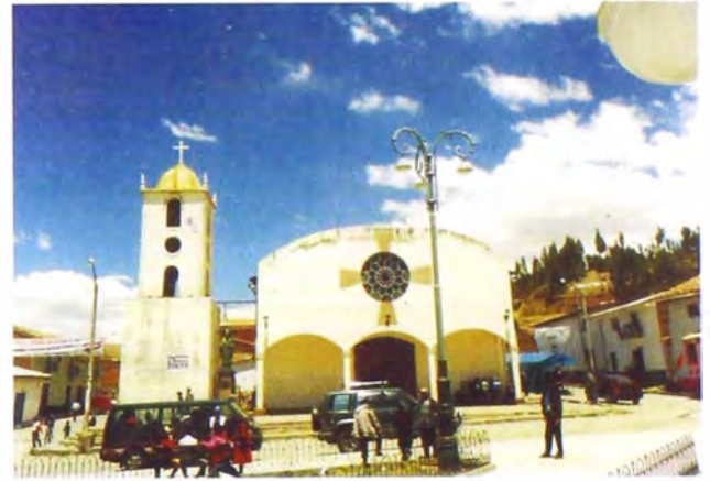
Foto 3. Iglesia de San Ildefonso de Recuay. Estado actual.

imagen de sociedad. La religión es el espacio donde se forman los grandes discursos del mundo, donde el mundo se hace –es hecho– inteligible; por ello, la explícita labor de la jerarquía religiosa de dictar pautas de comportamiento, ideas en general sobre el mundo, actitudes –predisposiciones– para que la feligresía se comporte frente a lo mundano.