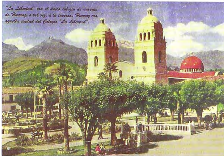
Foto 1. Catedral de Huarás antes del sismo de 1970.