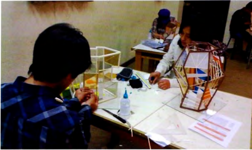
Foto 2. Alumnos diseñando siguiendo la teoría de las envolventes ortogonales con el uso de residuos inorgánicos reutilizados en el Taller de Diseño I de la Facultad de Arquitectura de la UNCP. (Semestre 2004-II).

Por lo tanto la EDA en el nivel intermedio, se realiza con cierta restricción, limitándose únicamente a las teorías que se encuentran en el marco de la EDS, por ello se determinó la poca atención que merece y la falta de compromiso con el medio ambiente en la enseñanza de los cursos de talleres de diseño, esto se puede afirmar luego de comparar este indicador con el enfoque de Manfred Max Neef (1998) donde se establece que: