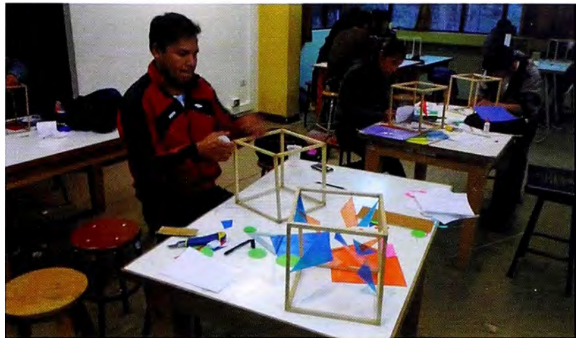
Foto 1. Diseño de propuestas volumétricas tridimensionales con la generatriz planimétrica con el uso de residuos inorgánicos reutilizados en el Taller de Diseño I de la Facultad de Arquitectura de la UNCP; (Semestre 2004-II).