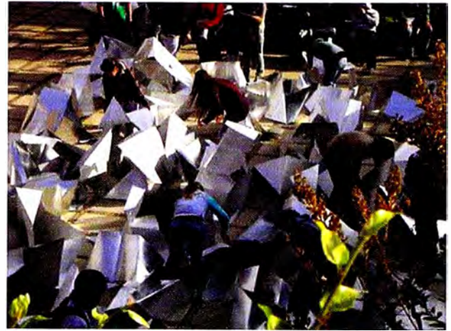
5. Módulo – ejercicio Transformación en abstracción 2010.