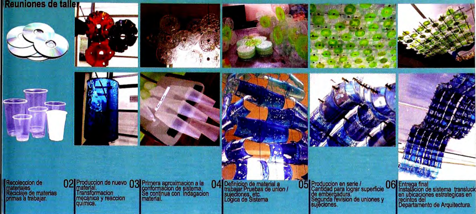
01 Recolección de materiales. Reciclaje de materias primas a trabajar.