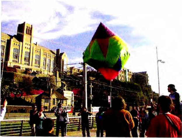
4. Módulo Temático Fenomenología 2010.