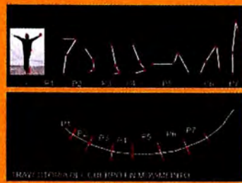
SUPERFICIE DE MOVIMIENTO MODELO DIGITAL