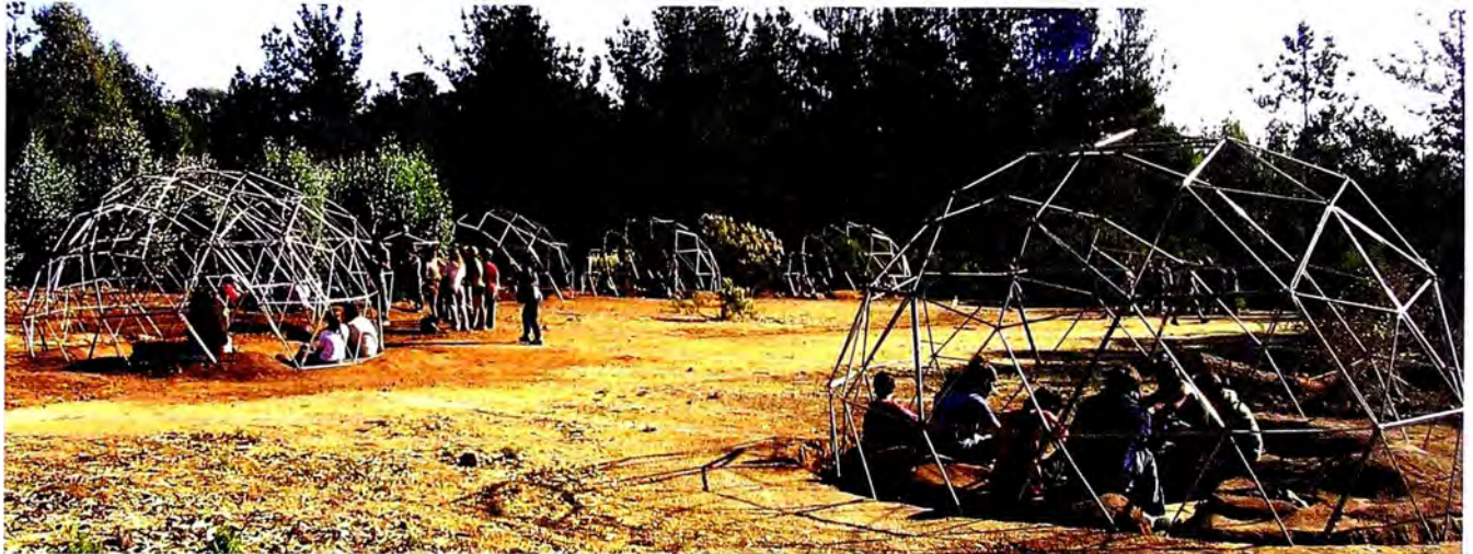
6. Módulo Fenomenología 2009.

funciones, entendiendo que la construcción de lo que se logra en el taller es trabajo de todos los involucrados, por lo que son sumamente importantes las instancias de diálogo, cercanía y horizontalidad en el desarrollo de las labores y jornadas del taller. 9