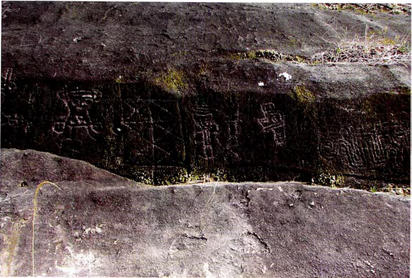
Figura 2. Petrograbados ubicados en las márgenes del río Colorado, distrito de Curubandé. Cantón de Liberia, Guanacaste, Costa Rica