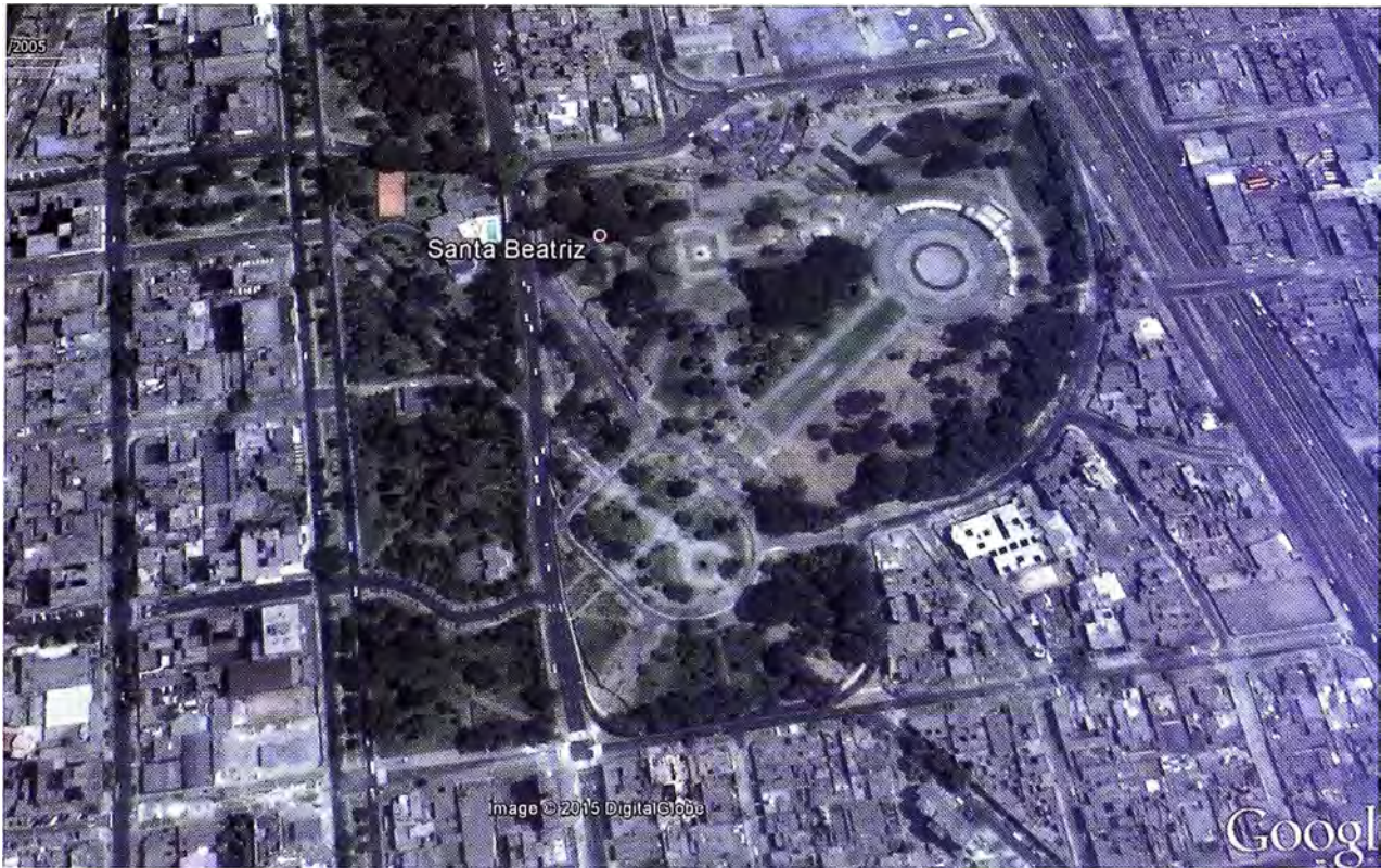
Figura 7. Parque de La Reserva, 2005. En esta fotografía todavía se aprecia el trazado original de Sahut.