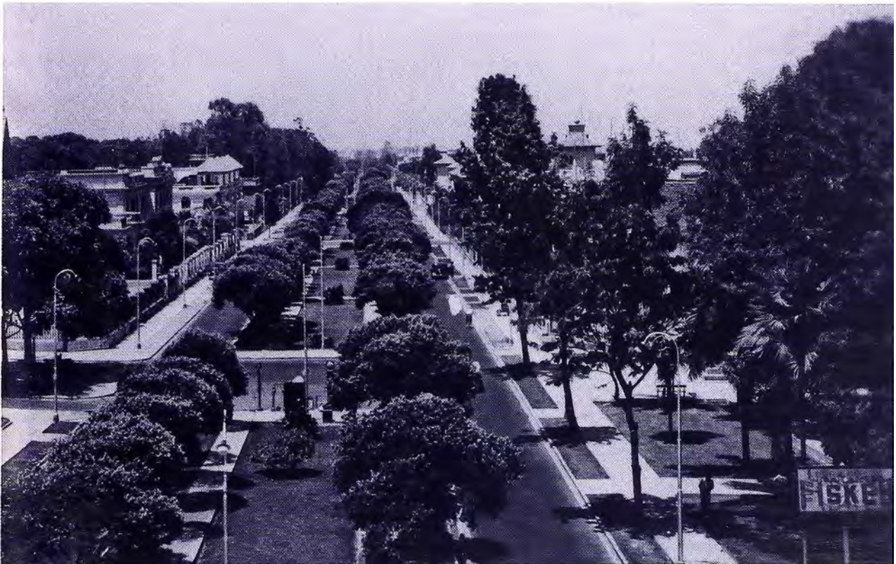
Figura 5. Av. Leguía (hoy Av. Arequipa), 1928.