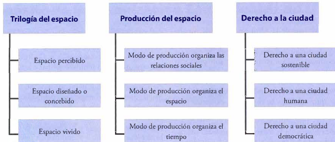
Figura 1. Dimensiones del pensamiento de Lefebvre.