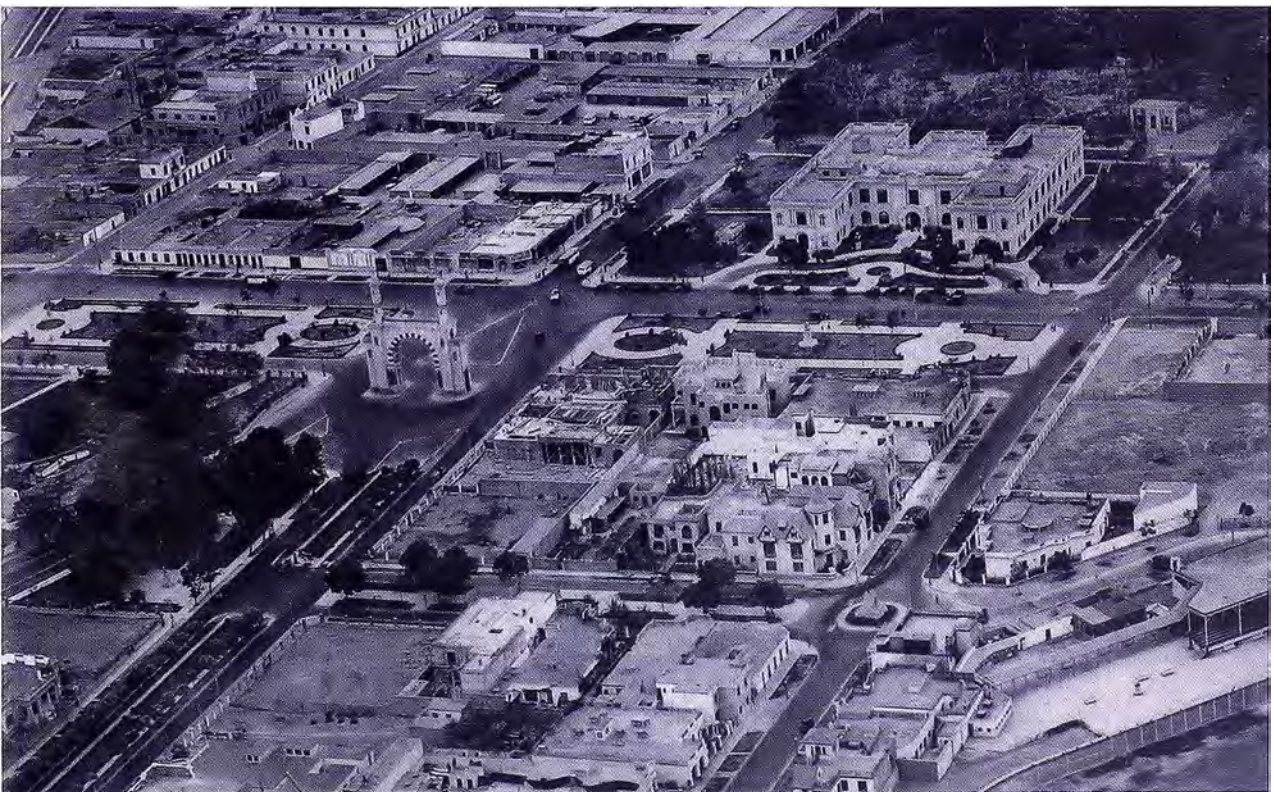
Figura 6. Urbanización Santa Beatriz, 1929. En la parte superior derecha, parte del Parque de la Exposición. A la izquierda la Av. Leguía y el Arco Morisco.