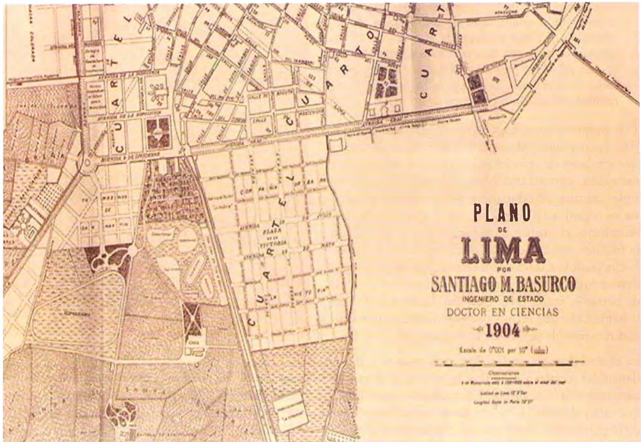
Figura 4. Plano de Lima de 1904 que muestra la ocupación inicial de las tierras de Santa Beatriz, con grandes usos destinados a la recreación.

Cuando el presidente Leguía 6 asume por segunda vez el poder, presenta el modelo de gobierno conocido como la construcción de la “Patria Nueva”: “Leguía representó la aparición de nuevos grupos e intereses locales, empresariales, burocráticos, profesionales y estudiantiles, que habían dado origen a las clases medias urbanas” (Contreras & Cueto, 2007, p. 234). La modernización y apertura al capital propuesta por Leguía se ve reflejada en la ciudad de Lima. El modelo urbanístico consistió en crear grandes avenidas y urbanizaciones –habilitaciones de uso residencial dirigidas a la clase media– para las zonas semiurbanas del perímetro urbano, entre las cuales se encontraban los terrenos de la urbanización Santa Beatriz. Buscó la expansión del Centro Histórico hacia el mar, mediante la construcción de nuevas avenidas, como la Av. Brasil y la Av. Leguía, hoy Av. Arequipa (Ver Figuras 5 y 6).