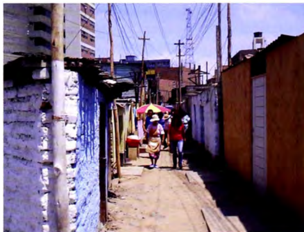
Figura 4: Interior del predio.