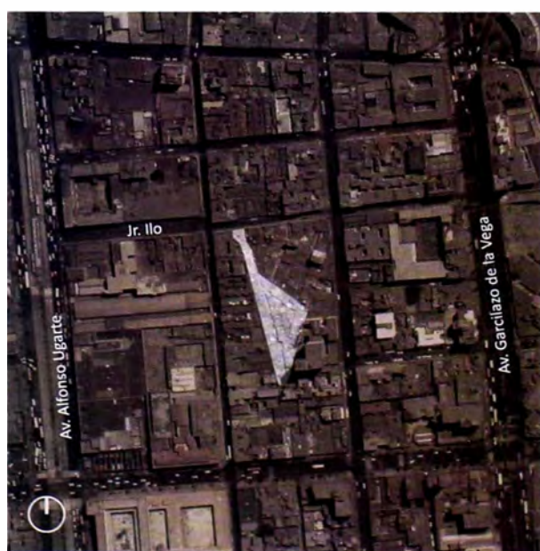
Figura 2: Ubicación del predio.

La evaluación social toma en cuenta los efectos indirectos y las externalidades que pueden generar un proyecto, además de considerar todos los beneficios y costos a precios sociales a fin de corregir las