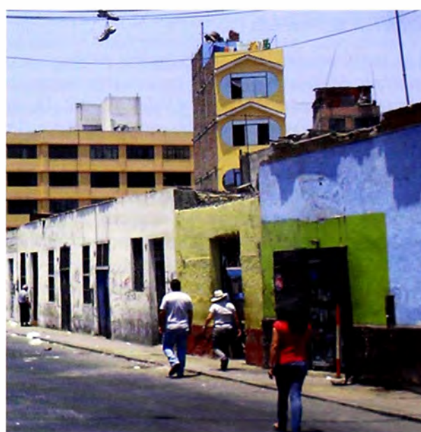
Figura 3: Fachada del solar.