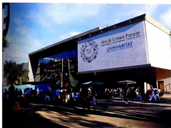
Figura 4. Foro urbano mundial.