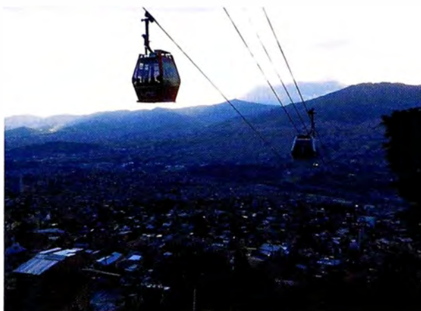
Figura 3. Teleférico.