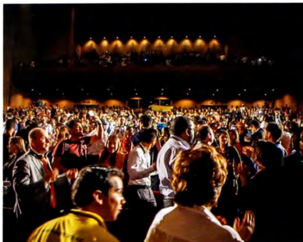
Figura 1. Gran salón. Sesión de clausura. Entrega de los premios del Hábitat y lectura de conclusiones.