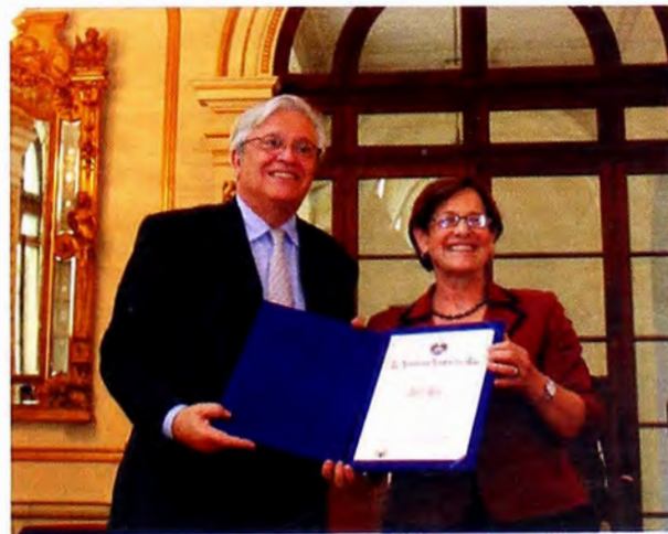
Figura 6. Alcaldesa de Lima reconoció a director ejecutivo de ONU - Habitat como Visitante Distinguido de la Ciudad.