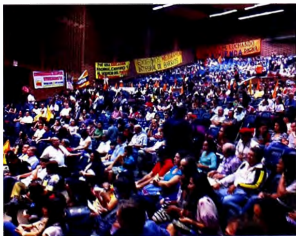
Figura 5. Masiva concurrencia al Foro Social Alternativo Popular.

Tenemos necesidad de repensar la ciudad, de pensarla bien. Espero que este relato del evento –al que no