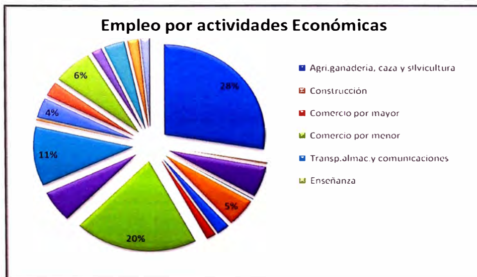
Gráfico 3.1.1.1: Empleo por Actividades Económicas