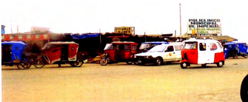
Foto 2.1.3.1. Mercado modelo Virgen del Carmen, esquina con carretera a Quilmaná, congestión de mototaxis y ocupación de espacios públicos.

Mediante visitas se constataron ocupaciones de vías públicas o áreas reservadas para usos diferentes a los residenciales, aspectos en las que se deberá tomar las medidas correctivas en el plazo más breve posible.