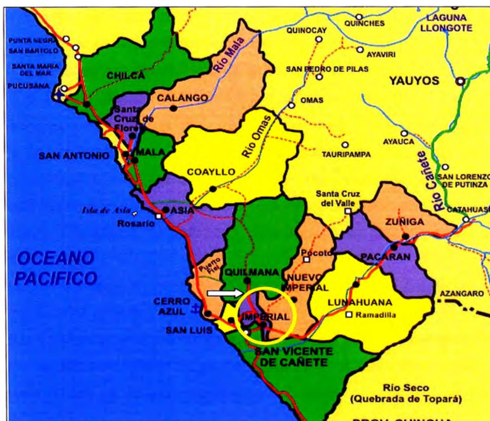
Mapa 1.1.1.1: Ubicación del distrito de Imperial dentro de la Provincia de Cañete

El Distrito de Imperial se encuentra ubicado a la altura del Km. 145 de la Carretera Panamericana Sur a 4 Km. hacia el Este del Distrito de San Vicente, por la Av. Benavides (Carretera San Vicente - Imperial), en la Provincia de Cañete, Departamento de Lima. El distrito limita hacia el norte con el distrito de Quilmaná, al Este con el distrito de Nuevo Imperial, al Sur con el distrito de San Vicente y al Oeste con el distrito de San Luis.