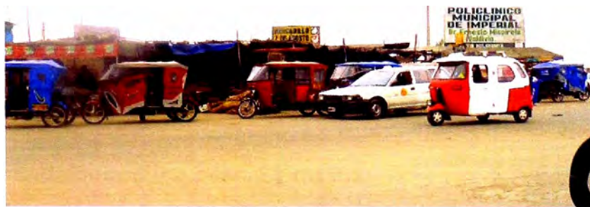
Foto 2.1.3.1. Mercado modelo Virgen del Carmen, esquina con carretera a Quilmaná, congestión de mototaxis y ocupación de espacios públicos.

Mediante visitas se constataron ocupaciones de vías públicas o áreas reservadas para usos diferentes a los residenciales, aspectos en las que se deberá tomar las medidas correctivas en el plazo más breve posible.