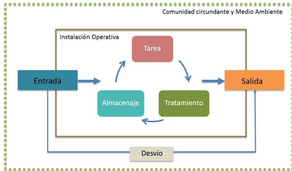
Figura 2.1 Ciclo del agua en operaciones mineras