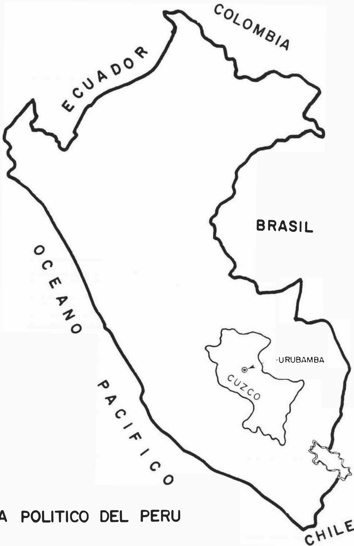
MAPA POLITICO DEL PERU