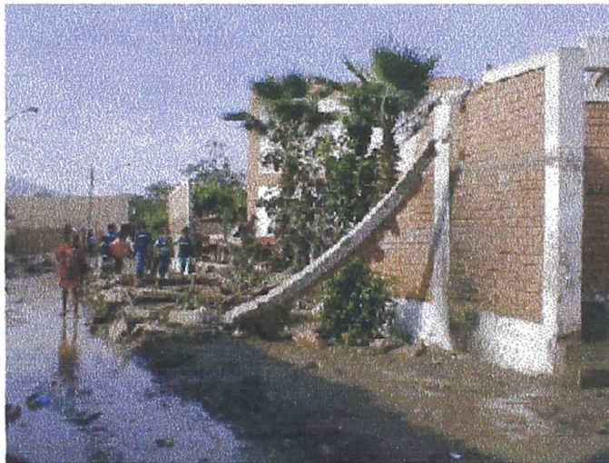
Foto 2. Falla del muro de colegio