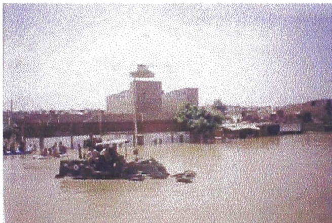
Foto 8. Zona Critica de Inundación