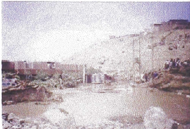
Foto 6. Abertura de emergencia para desaguar el área de inundación.