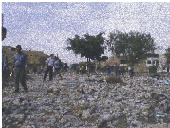
Foto 3. Material sólido depositado Parque altura calle Virgen de Guadalupe