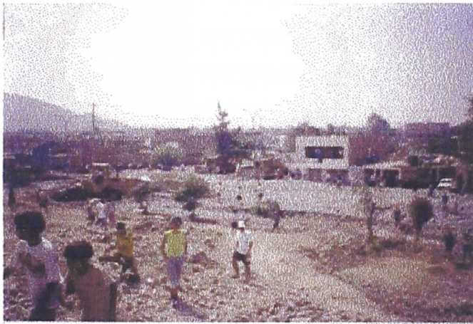
Foto 5. Acumulación del material sólido frente a la fisura del dique