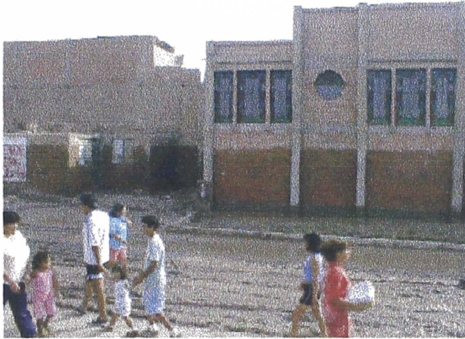
Foto 4. Iglesia en calle Copacabana – obsérvese la marca del máximo nivel de agua alcanzado.