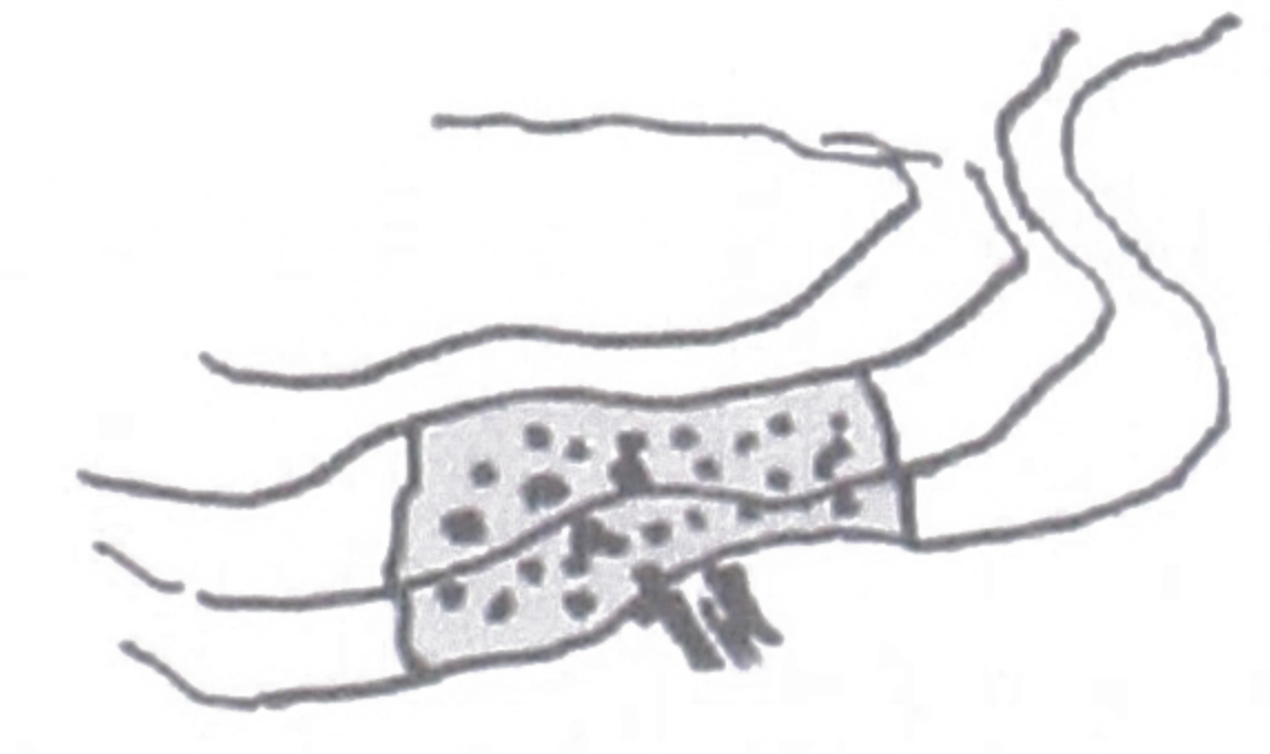
A. CONTENIDO EN QUEBRADA