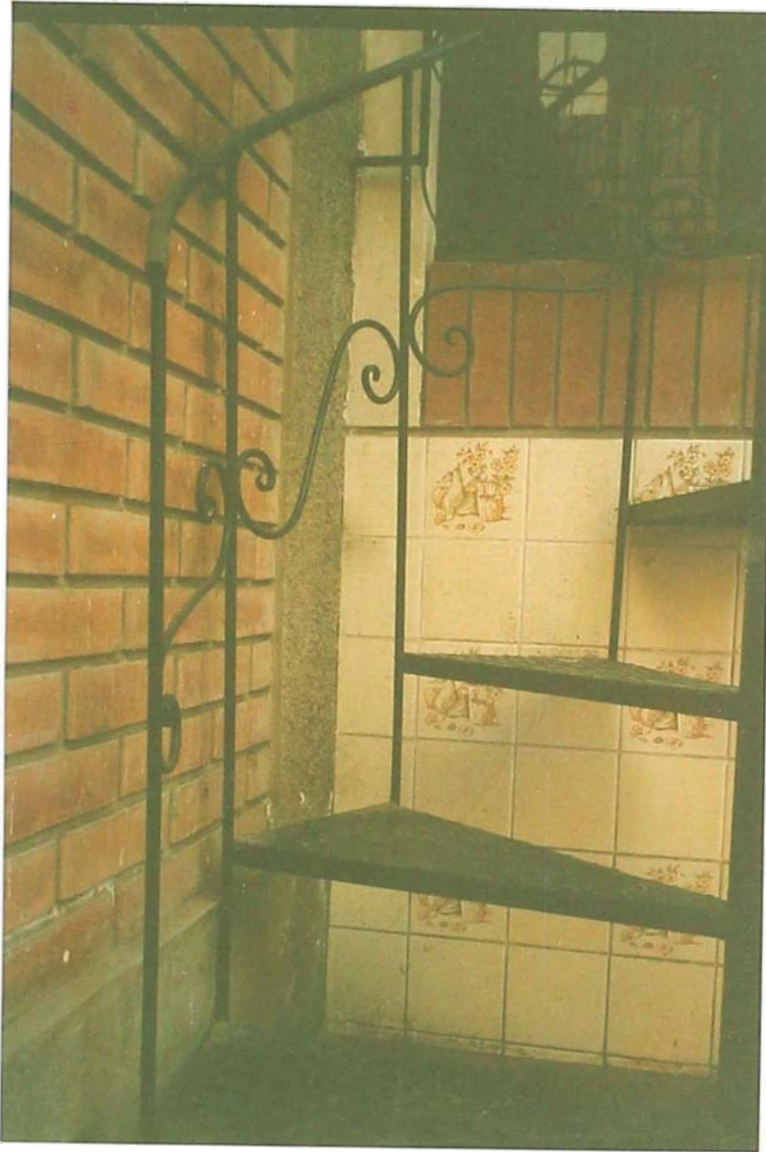
FOTO 12.- También nos muestra la escalera Caracol y en la vista se puede apreciar el arranque de la misma la baranda de fierro, y el parte de su desarrollo.