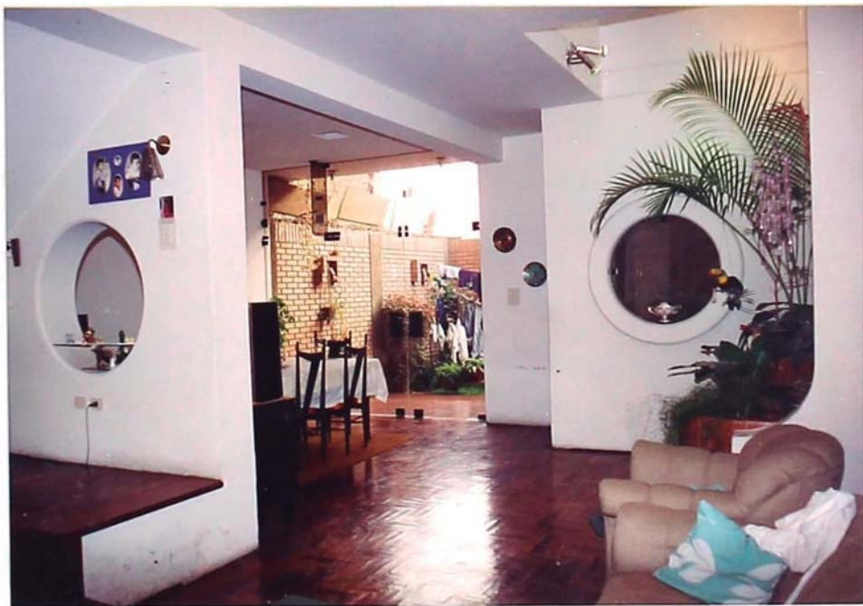
FOTO 04.- Vista interior panorámica de la casa habitación, desde la sala muestra la distribución en "L" de sala comedor dando la sensación de mayor amplitud a los ambientes que se complementan con la mayor altura del primer piso (2.85 metros), y la ubicación de la jardinera en la esquina.