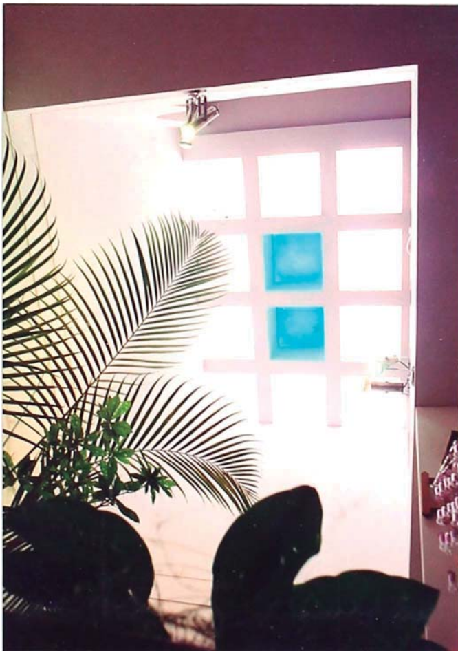
FOTO 06.- Vista de la jardinera que muestra su iluminación zenital mediante 12 cúpulas acrílicas de colores, que dan brillantez y la luz necesaria para el crecimiento de las plantas.