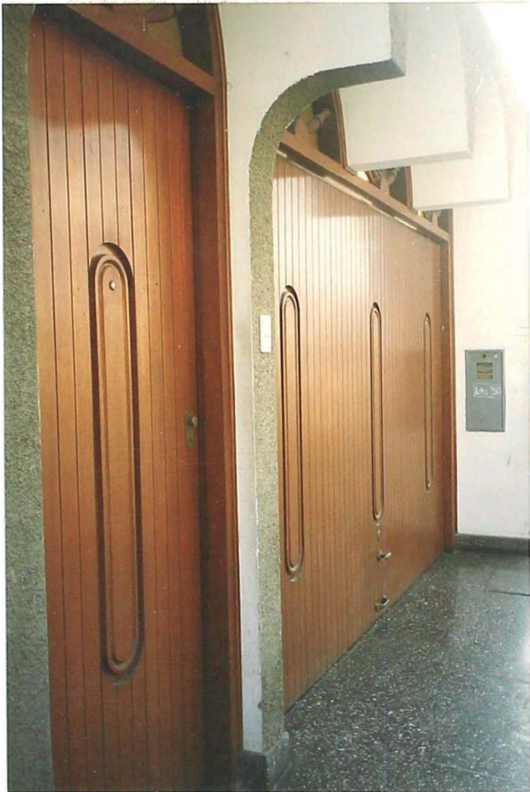
FOTO 08 y 09.- En las vistas tomadas se muestra en detalle el diseño de las puertas que dan a la fachada principal, apreciase que se conserva la unidad del conjunto entre los arcos y el detalle central en los paños de las puertas.