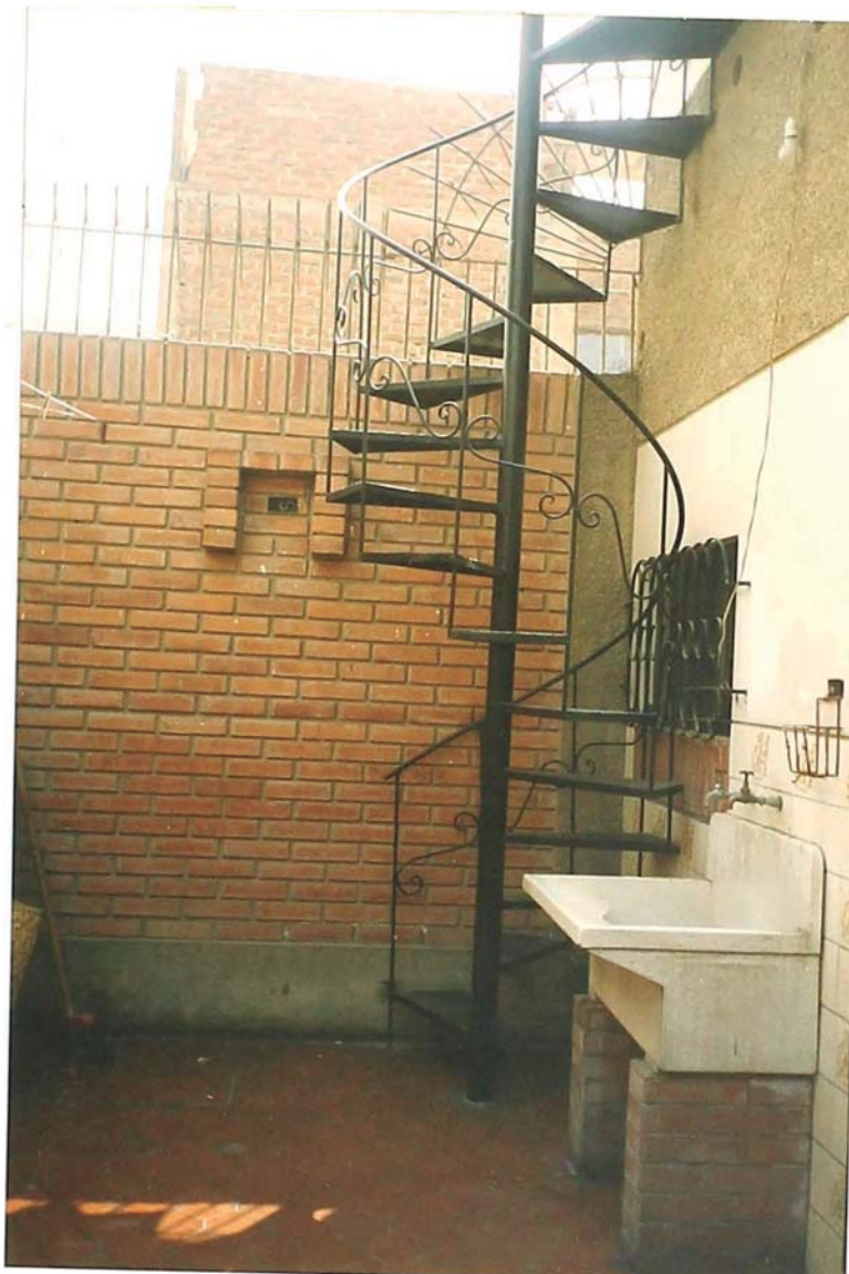
FOTO 11.- Escalera Caracol muestra la elevación y el desarrollo de la misma. En la vista se puede apreciar el detalle de los pasos y baranda de fierro, esta ubicada en el jardín que da a la fachada posterior.