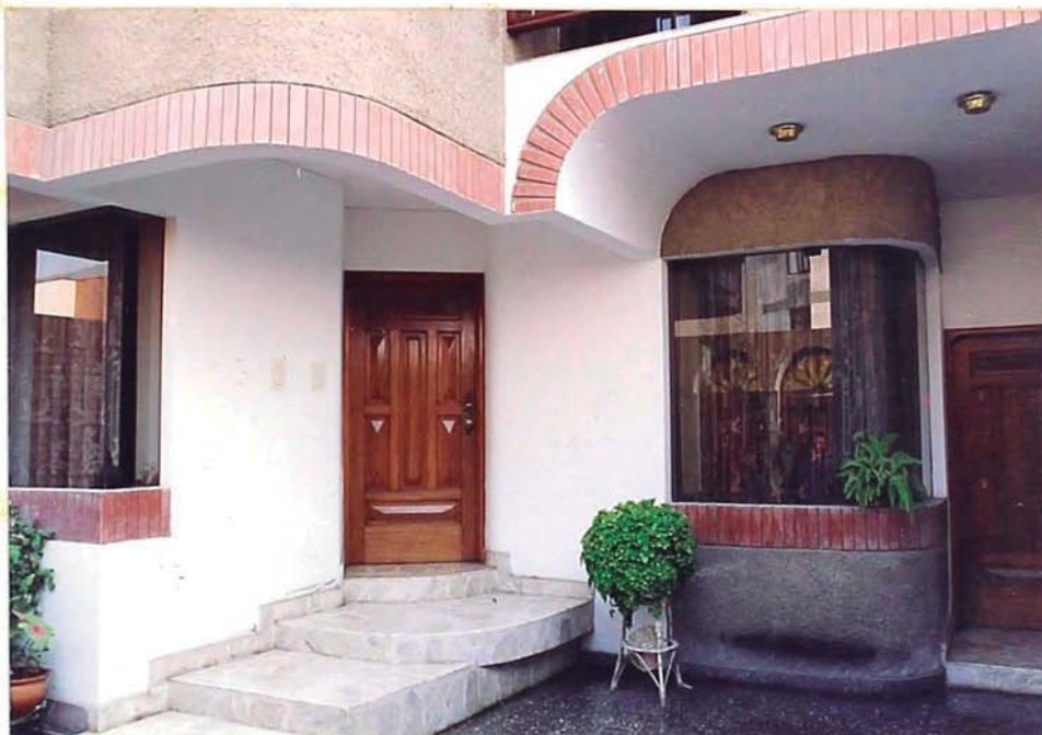
FOTO 02.- Se aprecia la fachada principal de la vivienda del 1º piso en donde predominan las formas de arcos en techos y muros que coordinan con la distribución del enchape cerámico, las puertas, escalinata de ingreso etc. Ver plano de Elevaciones.