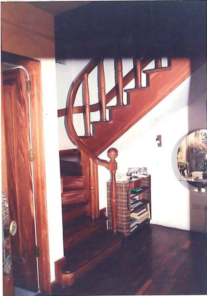
FOTO 03.- Vista interior tomada desde el recibo que distribuye de forma inmediata hacia el 2do. piso por la escalera, a la sala, S.H. visita Y a la biblioteca. Ver plano de distribución 10 piso.