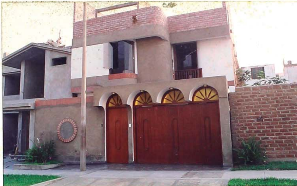
FOTO 01.- Vista de la Fachada principal de la vivienda, se ha tenido un cuidado especial en el diseño del cierre del frontis, coordinando todo el conjunto en el uso de arcos, muros curvos y ventanas circulares