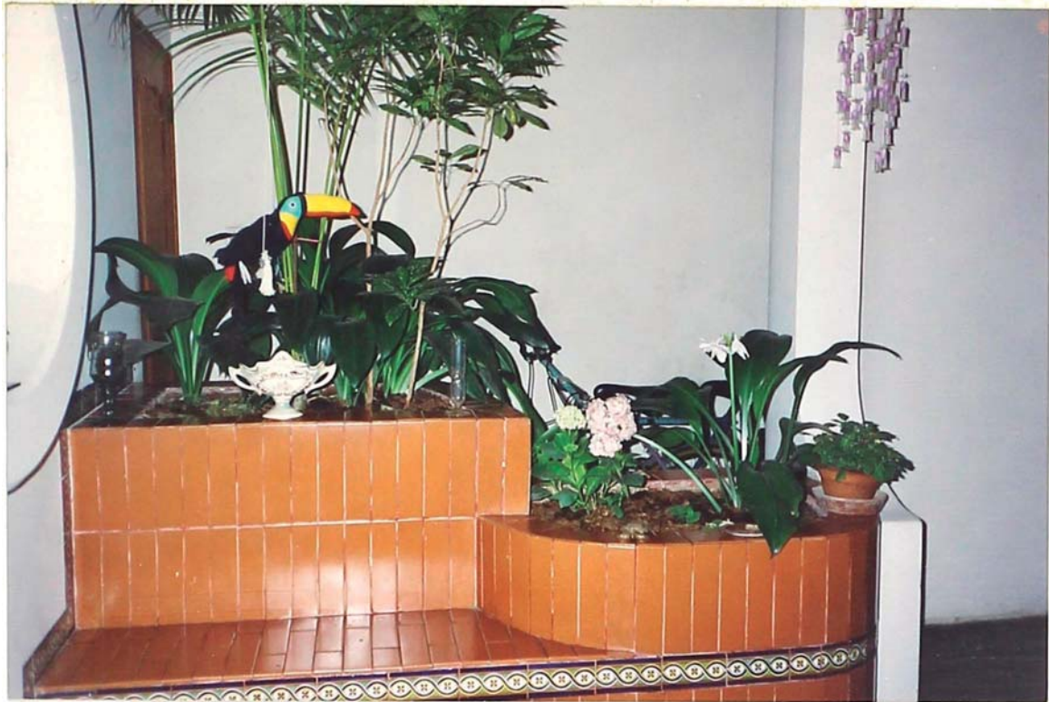
FOTO 05.- Vista de la jardinera, ubicada en el encuentro de la sala comedor (distribución en "L"), dicha jardinera es el punto focal de todo el ambiente, también da la sensación de mayor comfort e intimidad conjugándose el conjunto por el color de los enchapes, las plantas de interior, la doble altura y la forma con arcos de circunferencia.