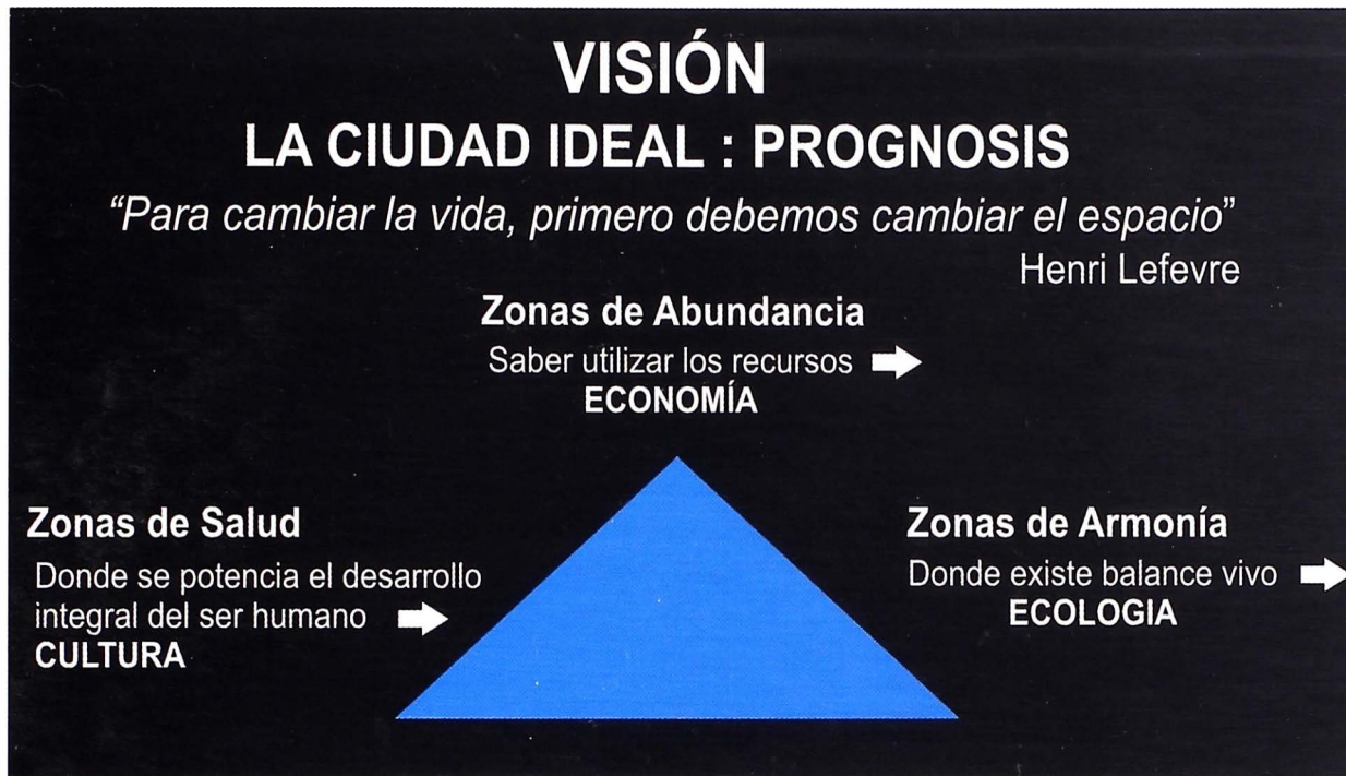
Fig. 2. Visión. La ciudad ideal: Prognosis.

Aprendizaje Constructivista: Concepto basado en la corriente pedagógica de Jean Piaget y a Lev Vygotski, en el que la enseñanza se percibe y se lleva a cabo como un proceso dinámico, participativo e interactivo del sujeto, de modo que el conocimiento sea una auténtica construcción operada por la persona que aprende, por el sujeto cognoscente.