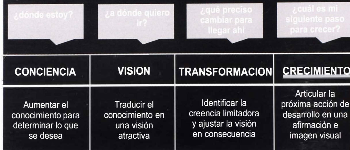
Fig.1. Enfoque metodológico.