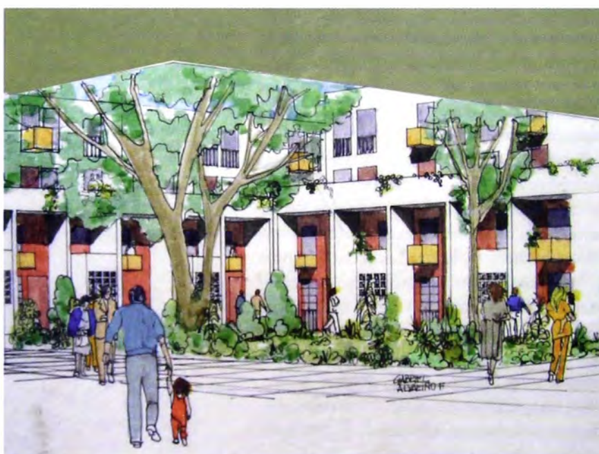
Figura 7. Proyecto de Miguel Alvaríno en Santa Cruz, con calle elevada por la que se accede a los duplex de nivel alto.