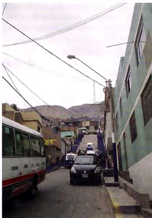
Figura 3. Calles, a veces estrechas, pero consolidadas y en fuerte pendiente, con presencia de abundantes mototaxis. Al fondo barriadas en formación sobre laderas empinadas (Chorrillos).

La presencia de los últimos paraderos del Metro de Lima todavía no incide en el desarrollo urbano de las áreas vecinas, lo que sí ha sucedido en la zona industrial inmediata al Este del distrito, la cual en realidad se ha convertido en comercial, especializada en carpintería, cuyo centro luce conjuntos edificadas de bancos y otros servicios en inmuebles de ocho y nueve pisos (ver Figura 4). En sus inicios la zona industrial pretendía atraer los talleres diversos de la zona de vivienda, pero sus lotes eran muy grandes y costosos para la población. Luego estos se subdividieron en lotes de menor área y se instalaron en ellos los talleres, con sus respectivas viviendas adosadas. Así, lejos de ser erradicados de las áreas de vivienda, los talleres se duplicaron, y las viviendas también. Después los talleres se convertirían en comercios, especialmente de carpintería, con lo que se constituiría en uno de los mayores centros comerciales de venta de muebles del país.