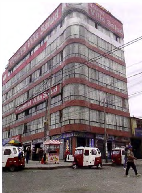
Figura 4. Edificios de gran envergadura y acabado en la zona comercial de VES.