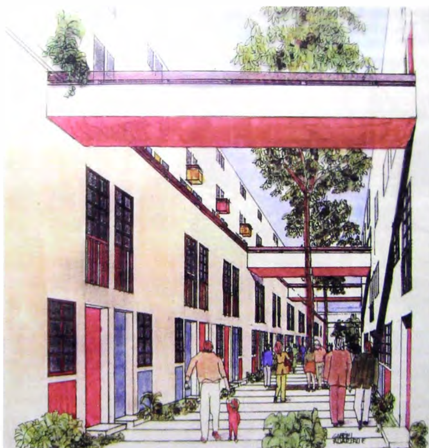
Figura 6. Calle elevada de la propuesta Miguel Alvaríno.