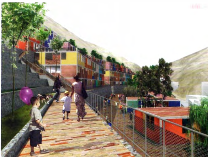
Figura 10. Vivienda en ladera, proyecto de tesis del arquitecto Martín Carrasco. Fuente: Carrasco, 2014.