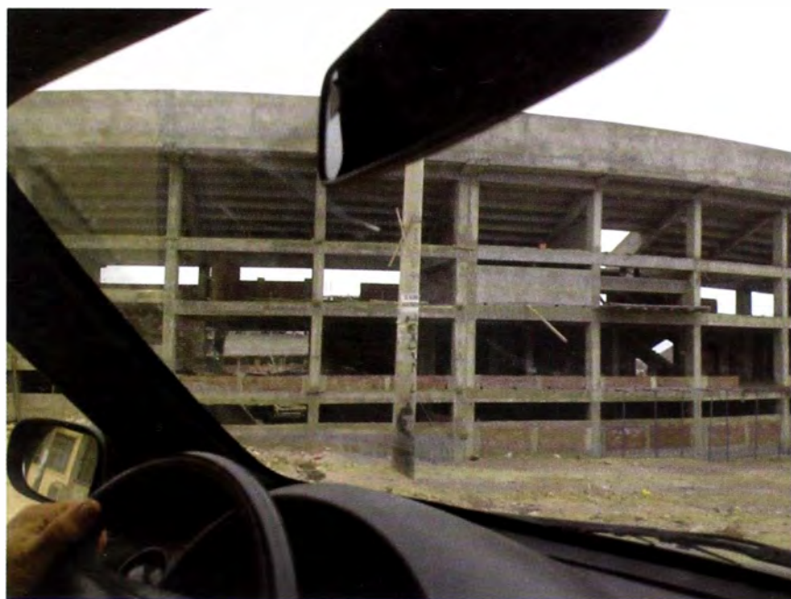
Figura 2. Estadio en construcción en San Genaro, Chorrillos. Todo un equipamiento distrital que servirá a varios barrios.