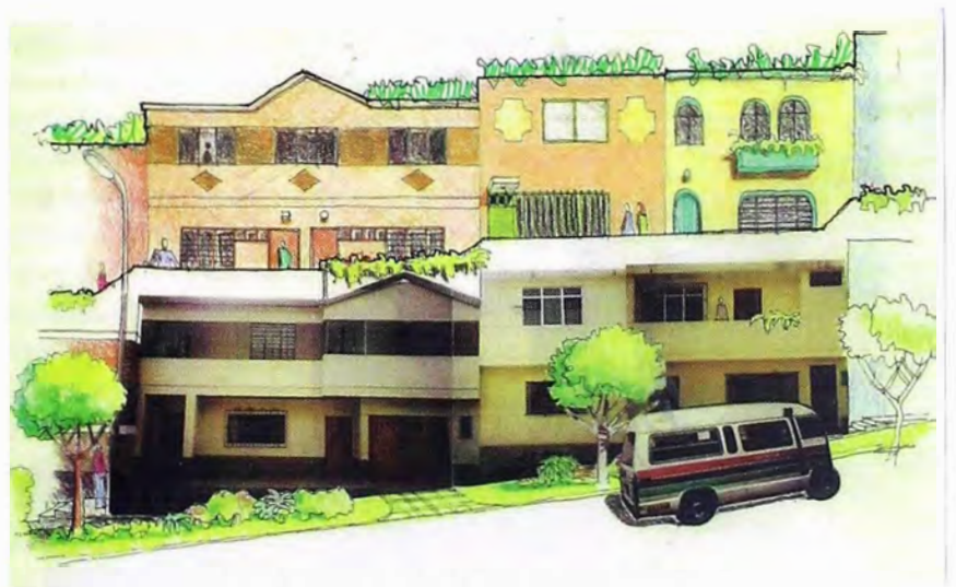
Figura 9. Detalle de calle Santa María donde se observa mediana pendiente y calle elevada en balcón, con propuestas de diseño de la población misma.