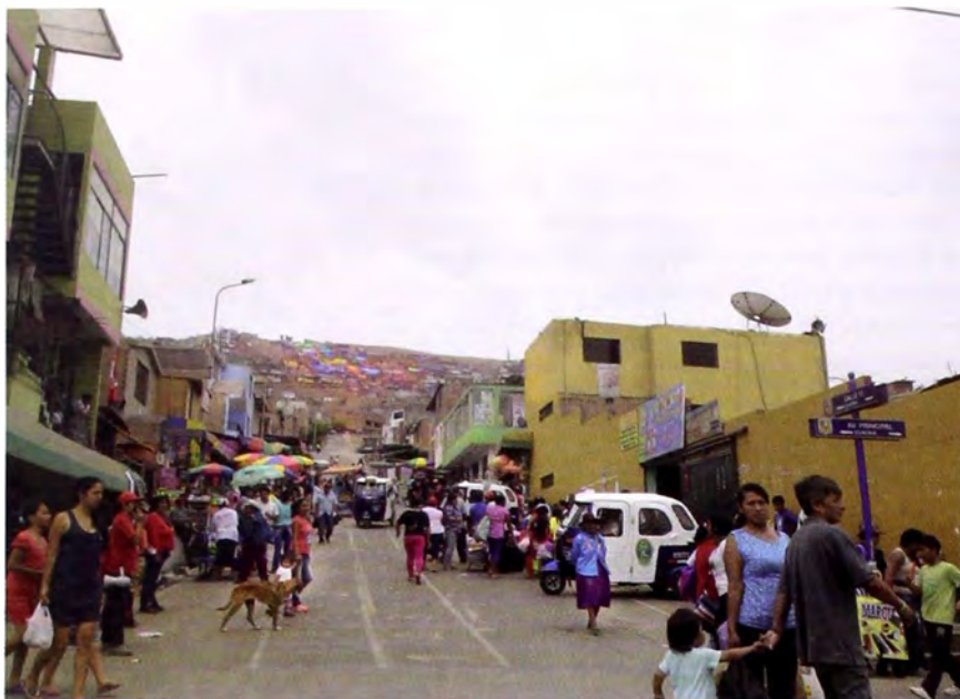
Figura 1. Calles pavimentadas, transporte, veredas, escaleras, jardines y casas pintadas sorprenden al visitante en Chorrillos.